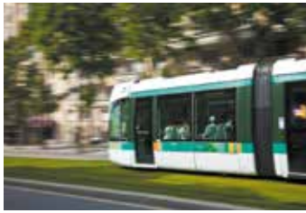
Le futur tramway et le bus à 250 m pour rejoindre son lieu de travail