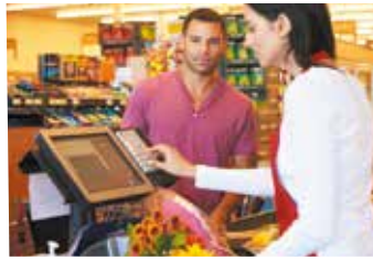
Le centre commercial à proximité permet de réaliser ses courses en toute facilité