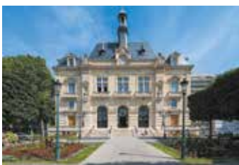
La Mairie pour toutes les démarches administratives