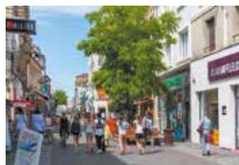
Le centre-ville est accessible rapidement pour profiter des boutiques, des terrasses, du cinéma, du théâtre...