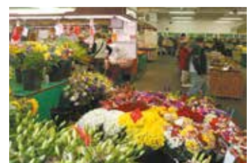
Les étals du marché des 4 routes tous les jeudis et dimanches