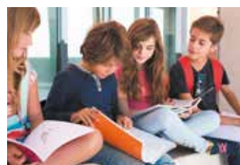
Pratique, l'école Victor Hugo à 350 m permet d'accompagner ses enfants à pied