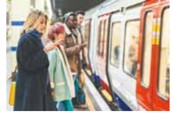
Métro Ligne 13 Les Courtilles (Saint-Lazare en 15 minutes)