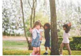
À 100 m, le parc Caillebotte, un des plus vastes parcs de Colombes, accueille enfants, promeneurs et sportifs